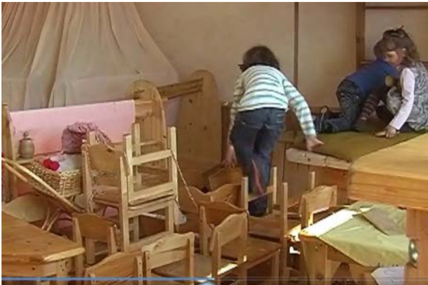
Из фильма «Возвращение игры», авторы Л.В. Свирская, В.К. Загвоздкин, видеоприложение к журналу «Обруч»