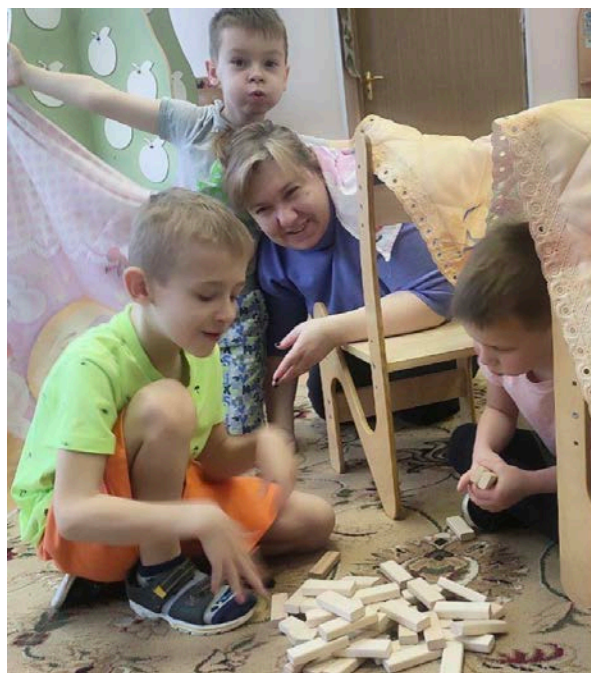
Игры в дошкольном отделении Школы № 1861 «Загорье», Москва