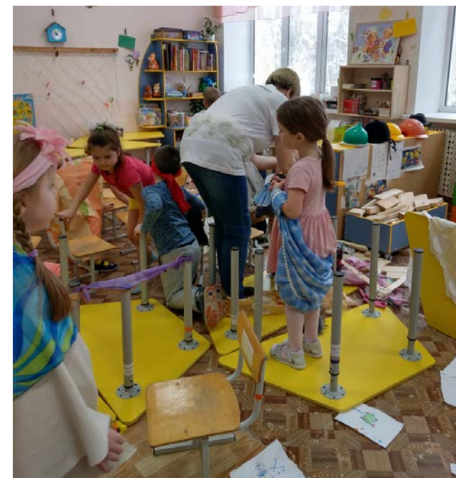
Игры в детском саду № 56, Кострома